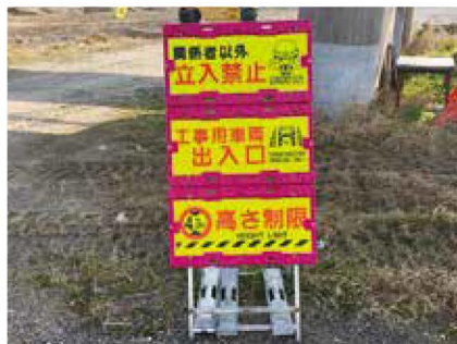
横 3 枚使用